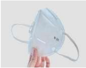
N95 / FFP2 veya FFP3 MASKELER